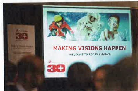
Tillotts Pharma: 30 Jahre Präsenz in der Schweiz.

Tillotts Pharma AG Baslerstrasse 15, 4310 Rheinfelden Tel. +41 61 935 26 26 www.tillotts.com